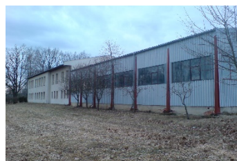
Hala praxe a odborného výcviku Nový Dvůr