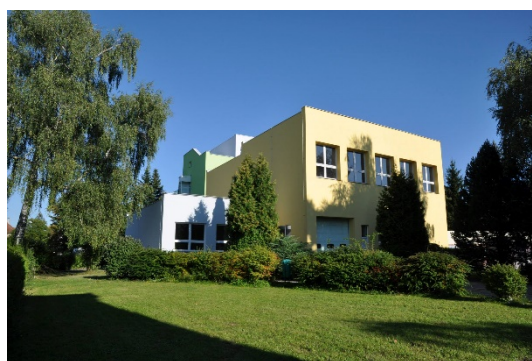
a areál školy