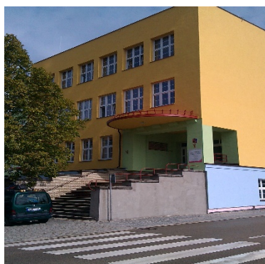
Budova školy Miřiovského 678