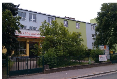
Budova školy Jáchymova 478