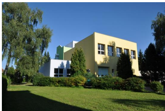
a areál školy