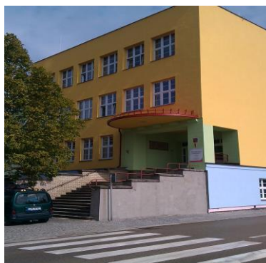
Budova školy Miřovského