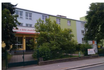
Budova školy Jáchymova 478