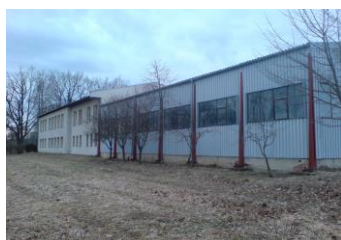
Hala praxe a odborného výcviku Nový Dvůr